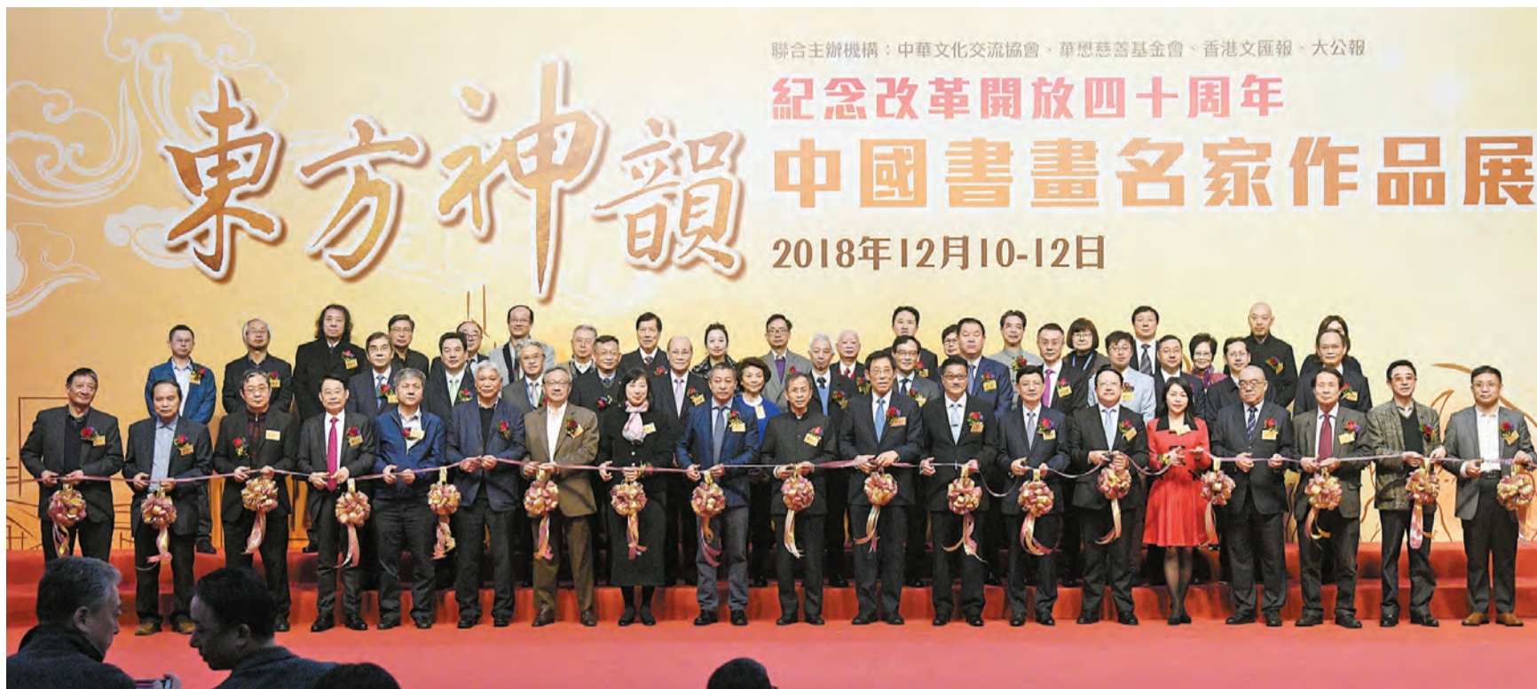
「東方神韻」中國書畫名家作品展昨日開幕，一眾嘉賓主持剪綵。 記者 蔡啓文攝

李大宏續稱，改革開放40年來，包括香港在內的中國書畫藝術生機勃發。日新月異的發展姿態，鑒古圖新的傳承精神，激發出內地和香港書畫藝術工作者的巨大創作能量，書畫佳作紛呈，書畫新秀輩出。可以說，國家改革開放40年開啓了又一個中華盛世，也催