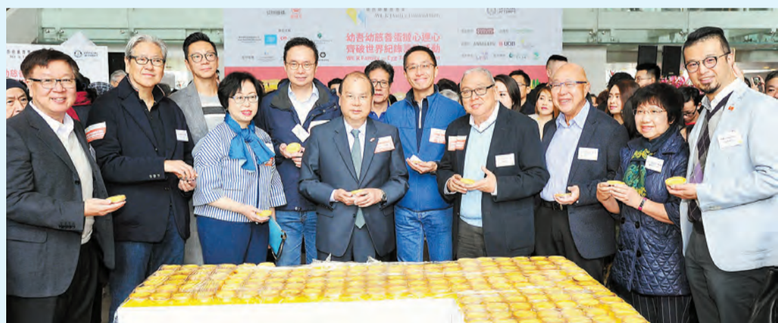
政務司司長張建宗(前左四)及幼吾幼慈善基金主席莊學熹(前右四)主持「慈善蛋撻心連心」籌款活動。

【香港商報訊】記者萬家成報道：幼吾幼慈善基金日前於樂富廣場舉行「慈善蛋撻心連心」籌款活動，成功以2333個香港經典食品蛋撻，打破健力士「最長蛋撻排列」世界紀錄。是次活動所籌得善款將全力支持幼吾幼慈善基金，為香港基層家庭及兒童提供之慈善服務，包括旗艦項目「333小老師培訓計劃」。